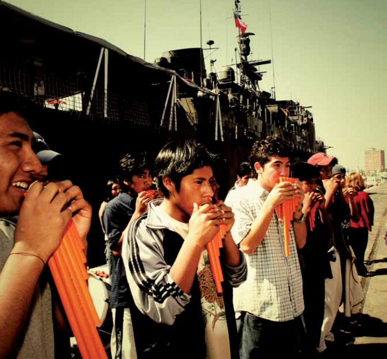
▲ Los sopladores son alumnos del Liceo de Putre.