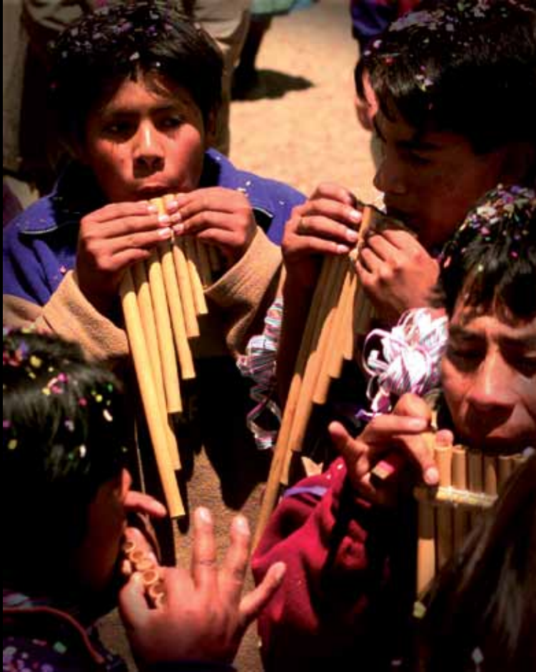
▲ 11 de febrero 2002. Inicio del Carnaval en el hito de la triple frontera cercano a Visviri, donde se realiza periódicamente la feria tripartita.