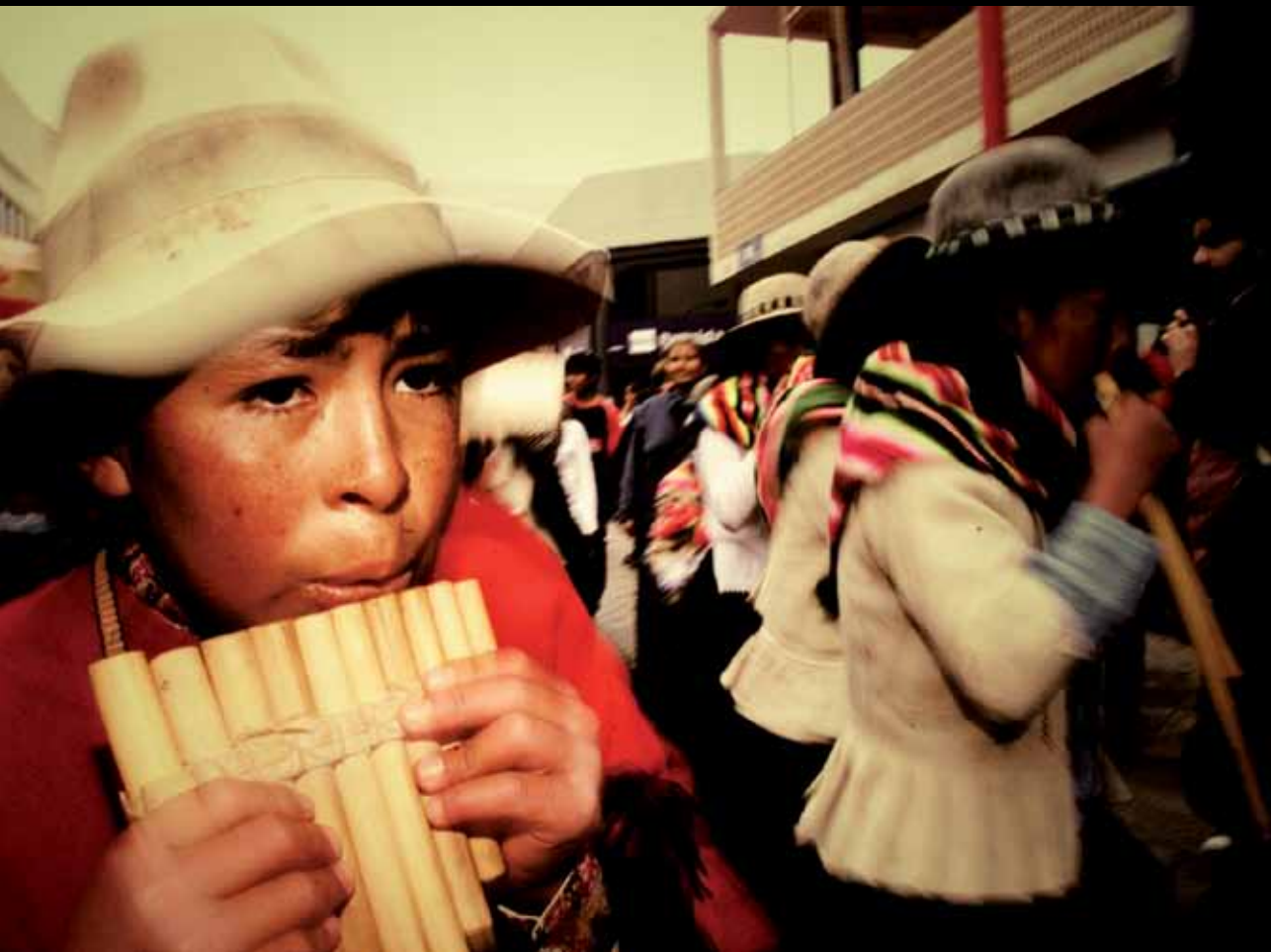
▲ El pasacalle lo componen siete parejas de niños de Charaña.