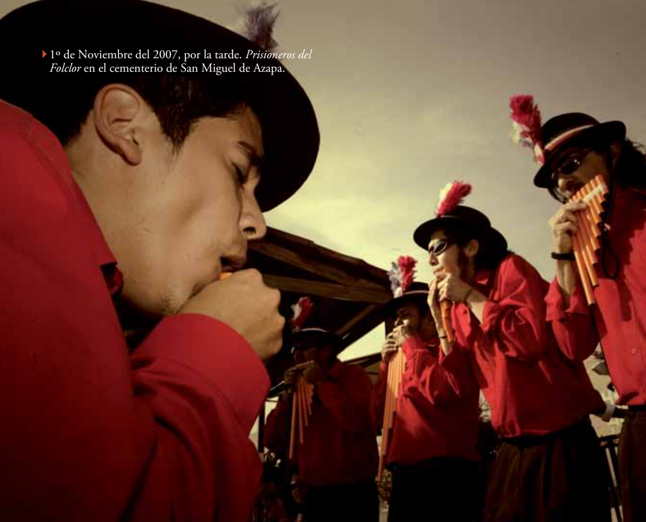
► 1° de Noviembre del 2007, por la tarde. Prisioneros del Folclor en el cementerio de San Miguel de Azapa.